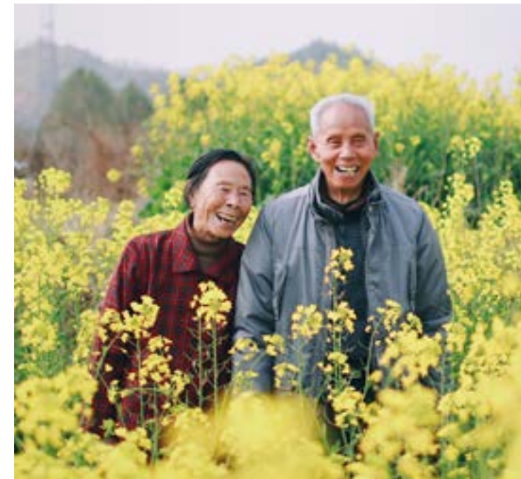
• Blue Zones