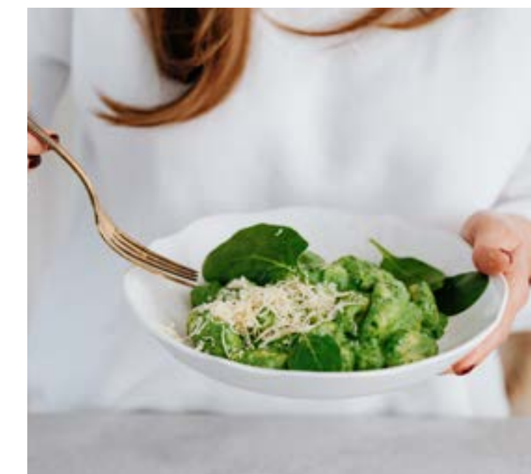
• Entzündungshemmende Ernährung – Nahrung als Heilmittel