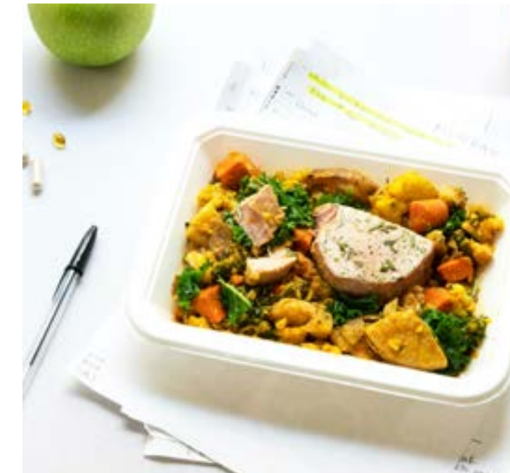
• Mindful Eating