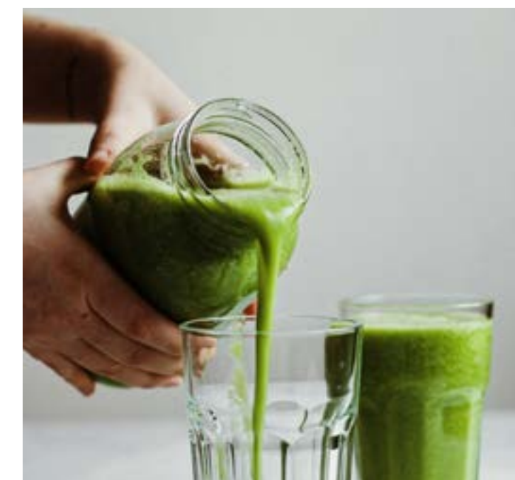
• Ernährungsweisen und Diäten