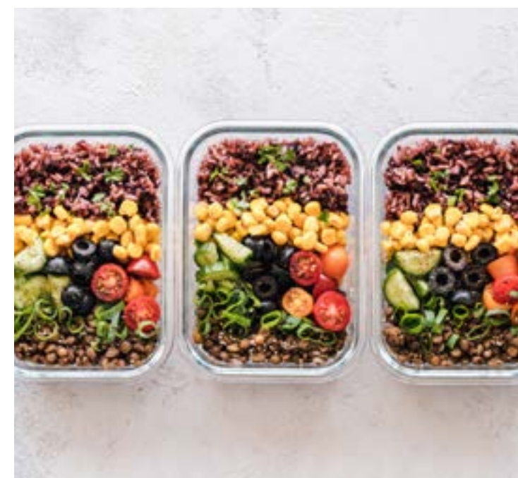
• Heimische Superfoods