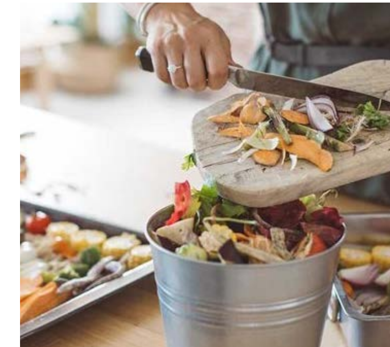
• Upcycle it - tschüss Food Waste, hallo Restverwertung