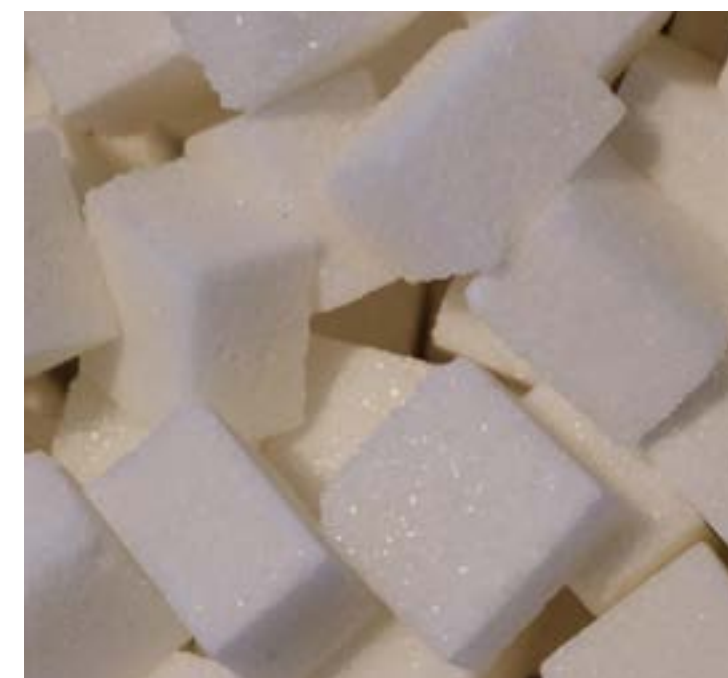
• Zündstoff Zucker