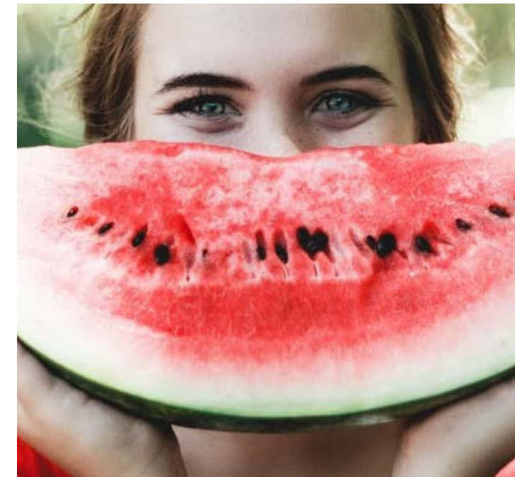
• Moodfood – stimmungsaufhellende Lebensmittelrtung