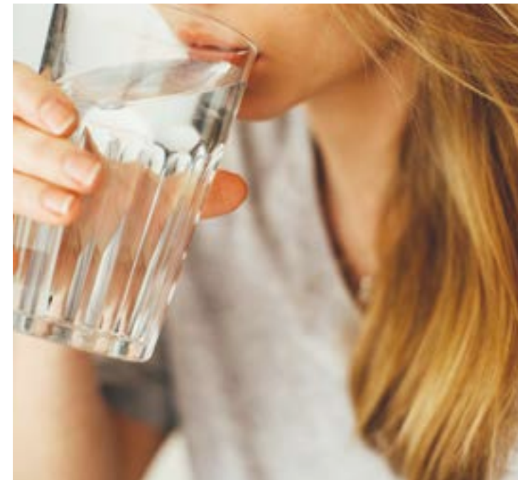
• Trink dich fit